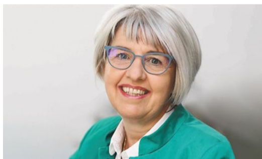
Elisabeth Baume-Schneider est conseillère aux Etats du canton du Jura et membre de la présidence du comité de Svizra27.

Une exposition nationale n'a pas de vertus magiques, mais favorise des effets bénéfiques sur